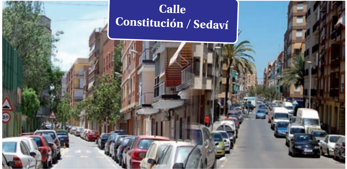
Calle Constitución / Sedaví